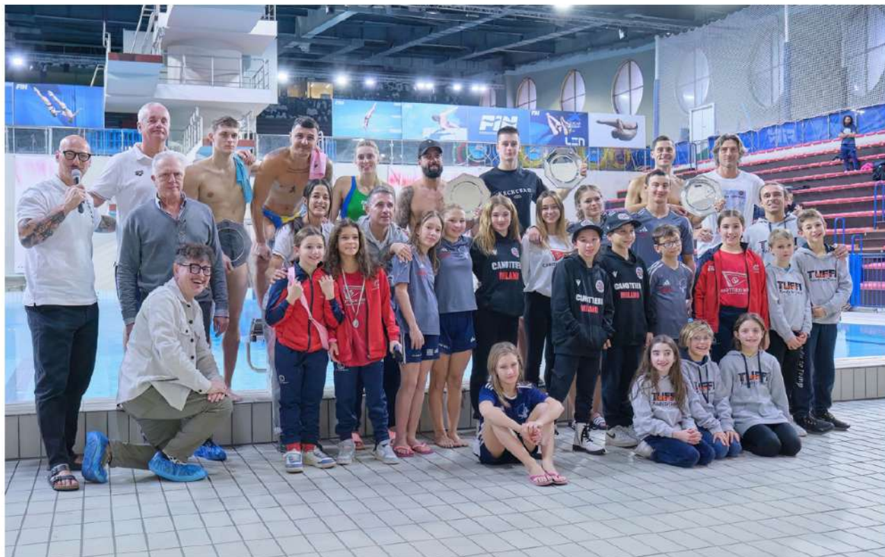
Nella foto gli atleti del Trieste Tuffi Show al completo.