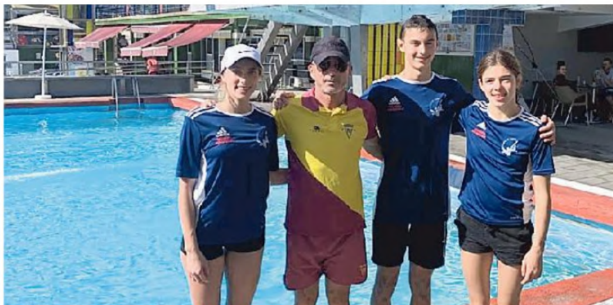
La delegazione della Trieste Tuffi