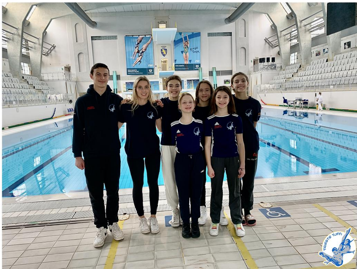
Nella foto la squadra della Trieste Tuffi nella piscina "Monumentale" di Torino.