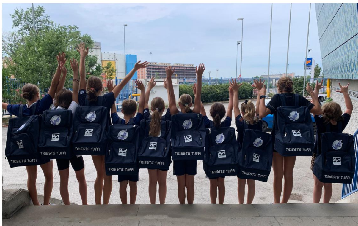
Nella foto la squadra agonistica della Trieste Tuffi.

In partenza la squadra agonistica per le gare di Roma e Fiume