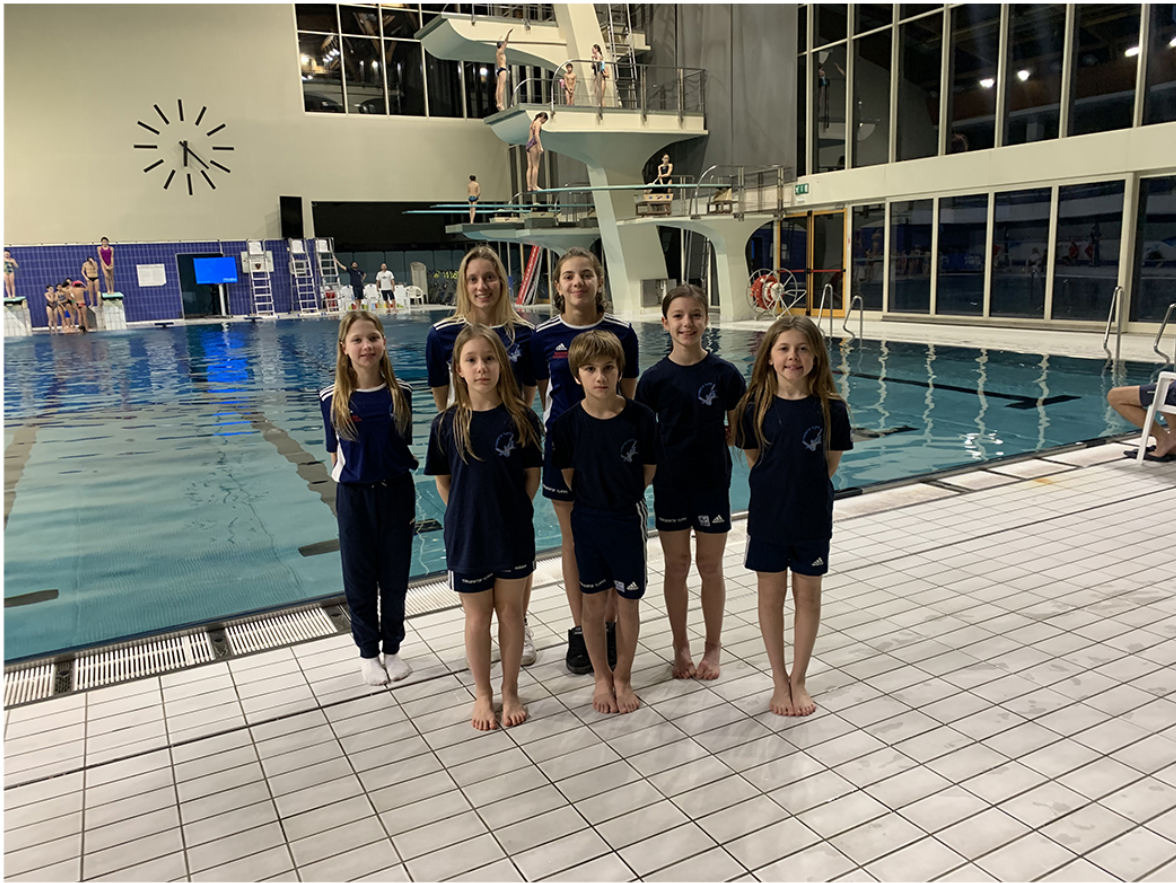
Nella foto la squadra della Trieste Tuffi nella piscina di Bolzano.