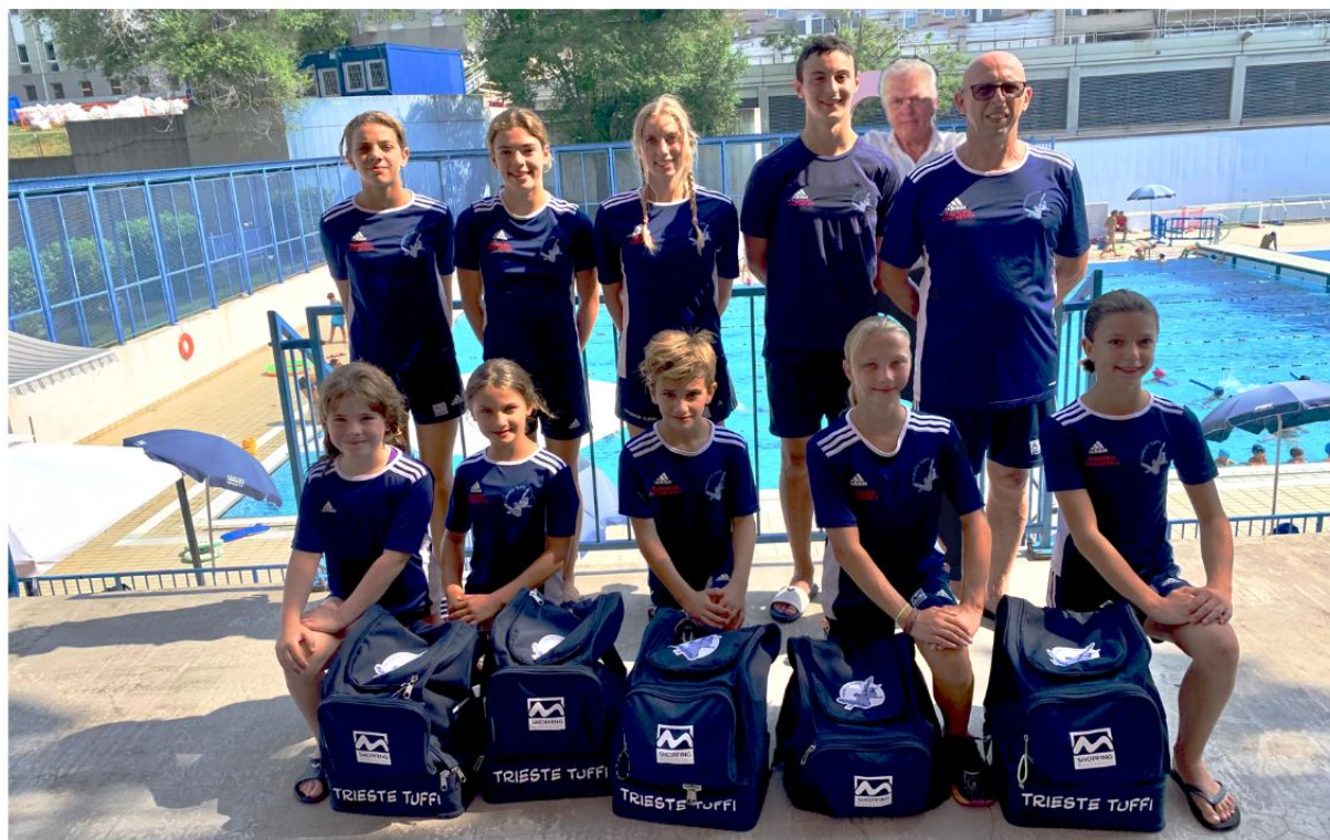
Nella foto la squadra agonistica e gli allenatori della Trieste Tuffi.