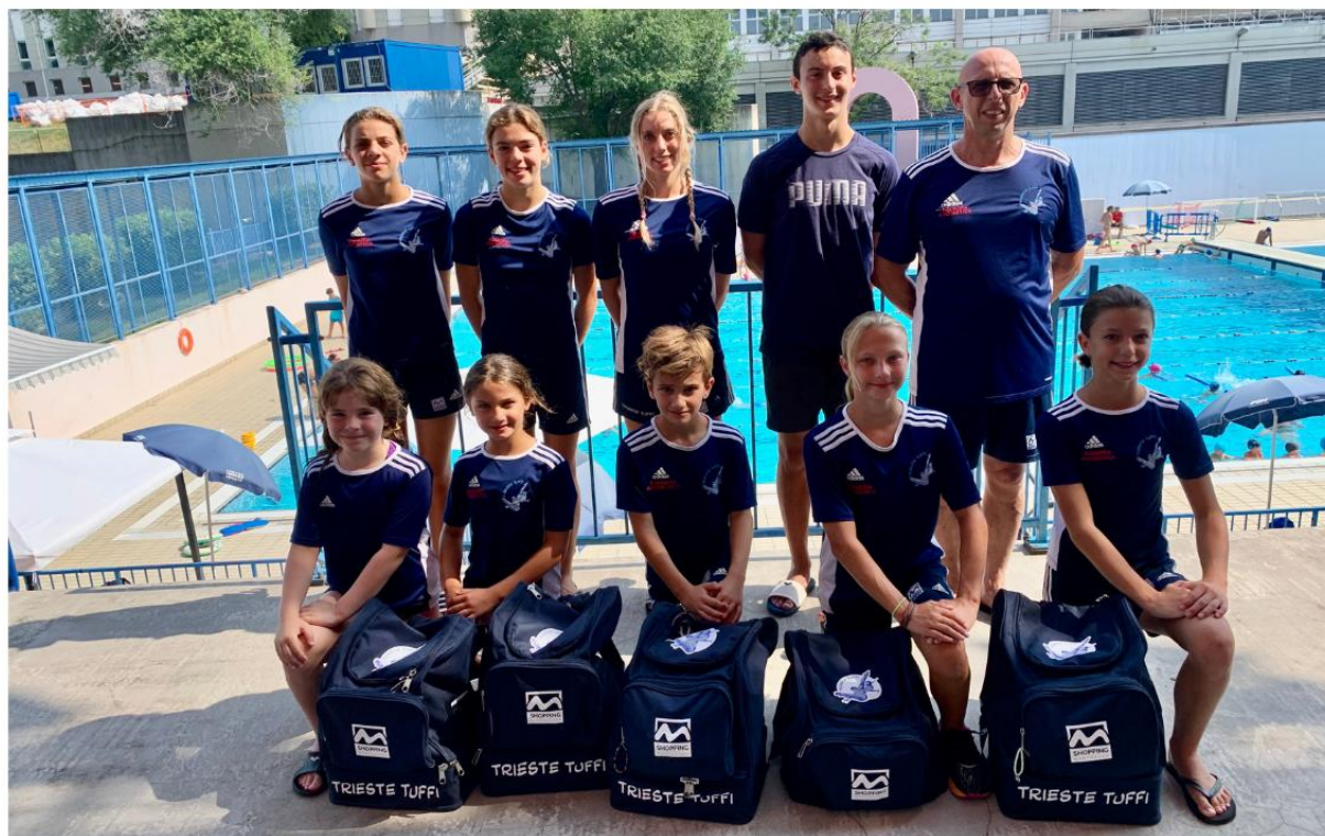
Nella foto la squadra agonistica e gli allenatori della Trieste Tuffi.