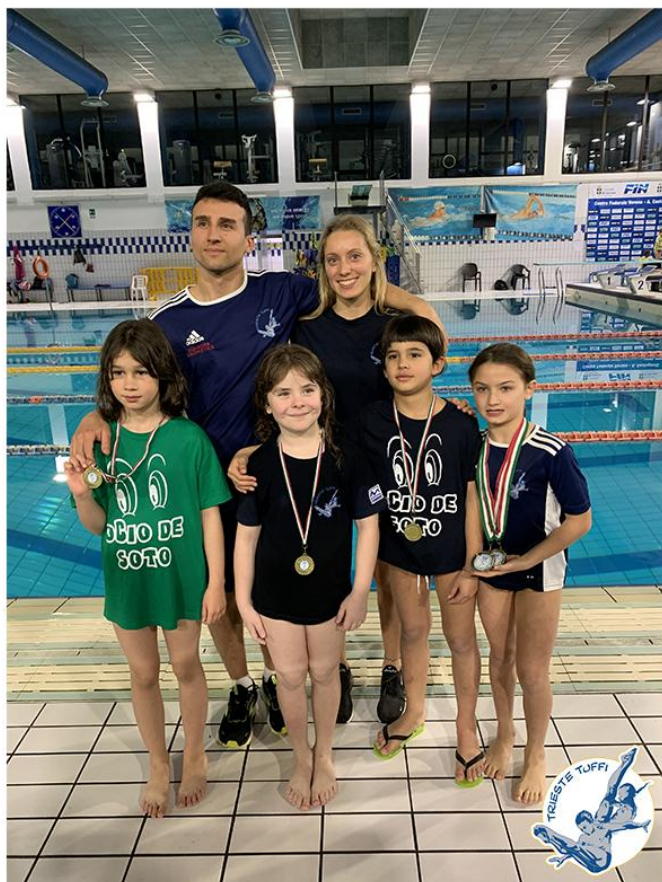
Nella foto la squadra che ha partecipato alla gara di Verona.